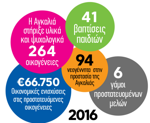
ΕΣΟΔΑ (Πηγές Χρηματοδότησης)

Στο Πρόγραμμα Οικονομικής Αναδοχής, μέσα στο 2016 συμμετείχαν 14 Ανάδοχοι, οι οποίοι στήριξαν με μηνιαίο επίδομα των (€100,00) 17 μητέρες, εκ των οποίων οι 12 βρίσκονται στην περιοχή της Αττικής και οι 5 στην υπόλοιπη Ελλάδα.